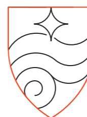
Forme de blason affinée + rappel architectural (vitreaux de l'église) Incarne les fondations historiques de Villers-sur-Mer.