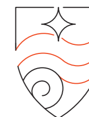
La mer Les champs Les falaises (strates) La forme incarne l'écrin entre mer et campagne.