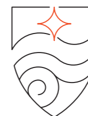
Étoile à 4 branches Stylisation graphique du méridien de Greenwich.