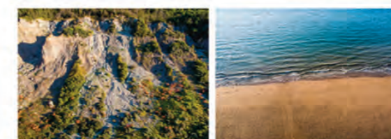
LES LIGNES NATURELLES DES FALAISES & DE LA PLAGE