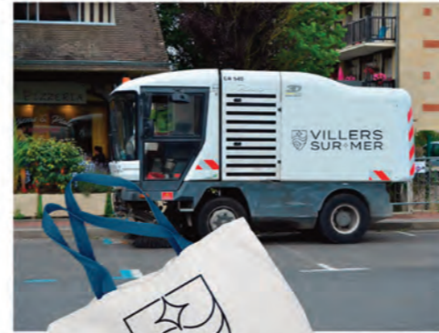
DÉCLINAISONS VÉHICULES & GOODIES