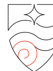
Fossile d'Ammonite Représente la richesse paléontologique des Vaches Noires.