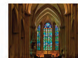
LA FORME DES VITRAUX