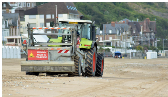
L'été, la plage de Villers-sur-Mer est tamisée trois fois par semaine

Ce travail de l'ombre est important. "Les riverains qui nous croisent en allant à la boulangerie nous saluent avec des grands coucous et nous remercient pour le travail