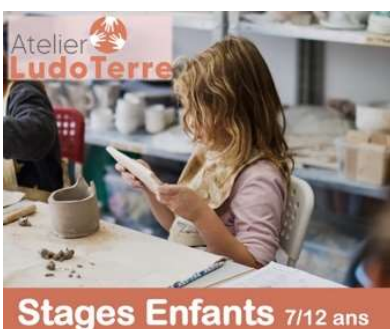
Stages Enfants 7/12 ans

Venez découvrir le modelage sur argile et créer votre propre sculpture.