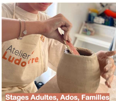
Stages Adultes, Ados, Familles