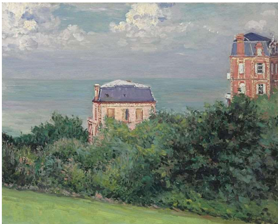
Gustave Caillebotte - Villas à Villers-sur-Mer – 1880 – Huile sur toile – Collection particulière.

En effet, durant l'année 1880, Gustave Caillebotte passe l'été dans notre station balnéaire et immortalise vallons, panoramas vers l'immensité marine et reliefs escarpés des falaises des Vaches Noires. Passionné de nautisme, il prépare également des régates à Villers où son voilier "Ines" était amarré.