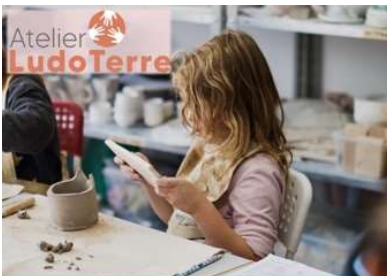
Stages Enfants 7/12 ans