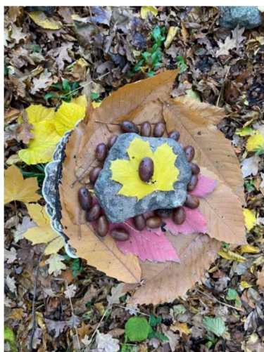
Photo marche créative

Inscription sur place. Renseignements 06 88 35 72 42