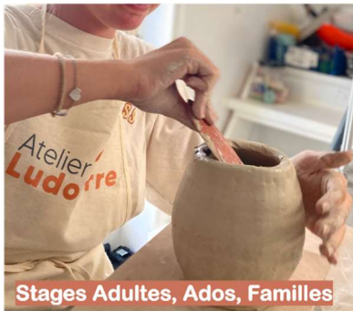
Stages Adultes, Ados, Familles