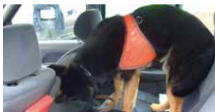
Le chien est dressé pour détecter la présence de stupéfiants dans les véhicules

Un message dissuasif. Cette opération de contrôle anti stupéfiant se veut plus dissuasive que répressive. C'est le message délivré par la gendarmerie, afin de tenter d'enrayer ce phénomène qui touche toutes les couches de la population et « peut conduire à des comportements agressifs et détruire la santé. Nous multiplierons ces contrôles dans la région durant les mois à venir » indique Jacques Bouyssou.