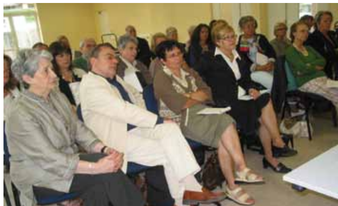
Les bénévoles de l'ASPEC en stage de formation

Pratique : ASPEC, antenne de Villers-sur-mer, mairie annexe, tel : 02.31.14.64.13 ou 06.07.09.44.30