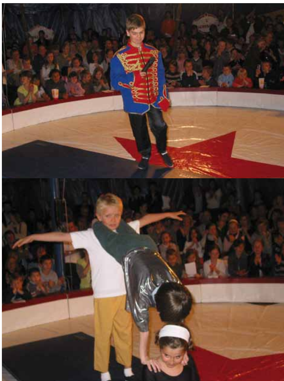
L'équilibre était l'une des activités proposées

En résumé, une soirée de bonheur pour petits et grands.