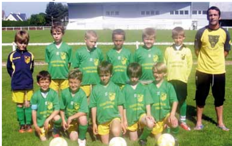
Les U9 (Boulangerie Placier)