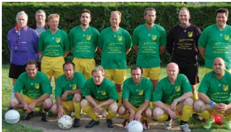
Les seniors (Boulangerie La rose des sables)