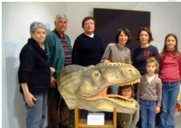
Le Club des jeunes paléontologues