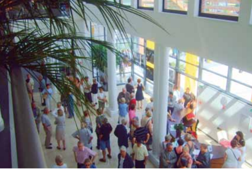
Le public dans le hall du Villare;