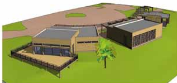
1 Vue 3D 13 Ech 1