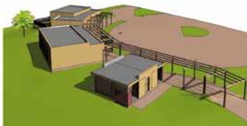
3 Vue 3D 14 Ech 1