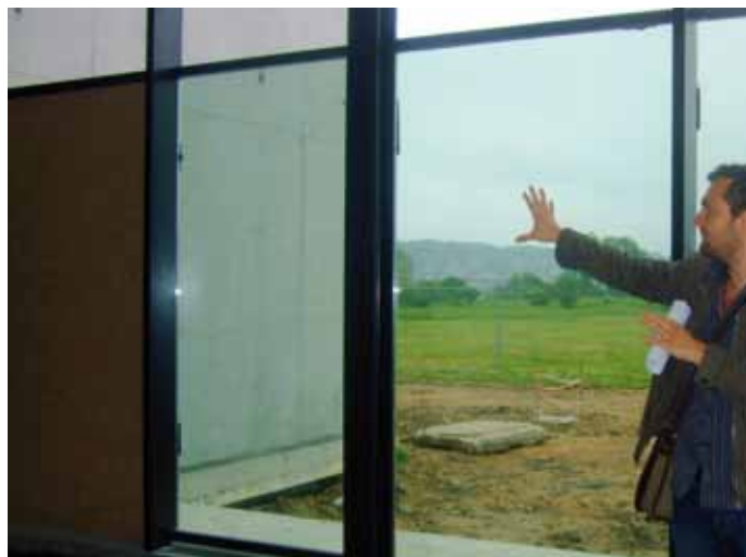
Les baies vitrées ouvrent sur l'espace naturel du Marais.