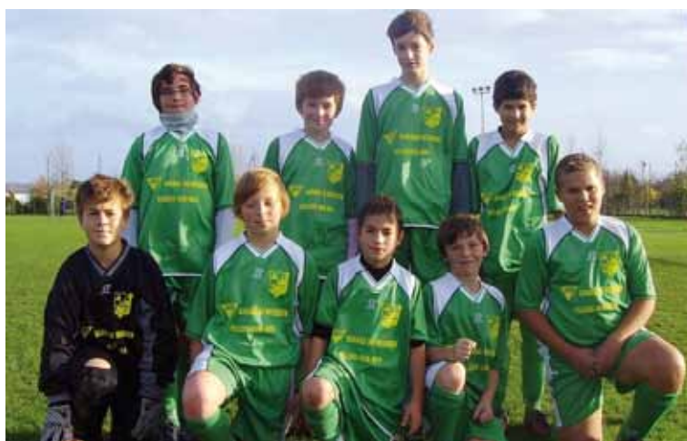
Les U13 (Garage du méridien)