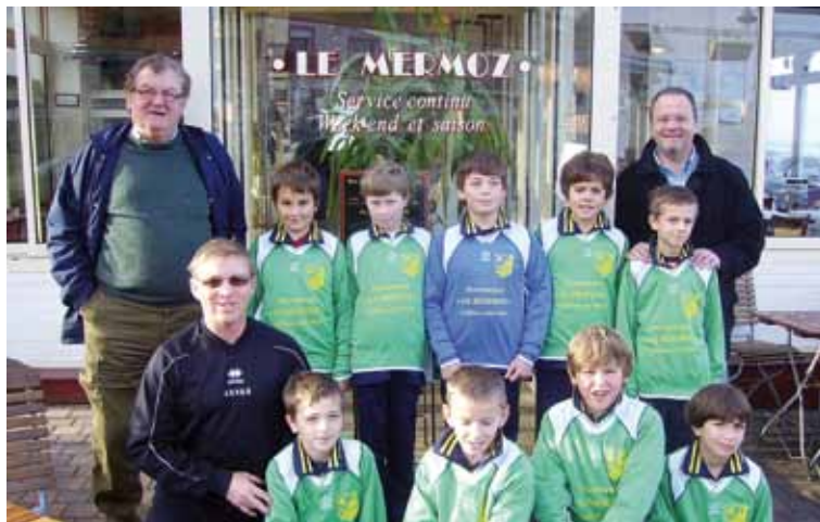
Les U11 (Restaurant Le Mermoz)