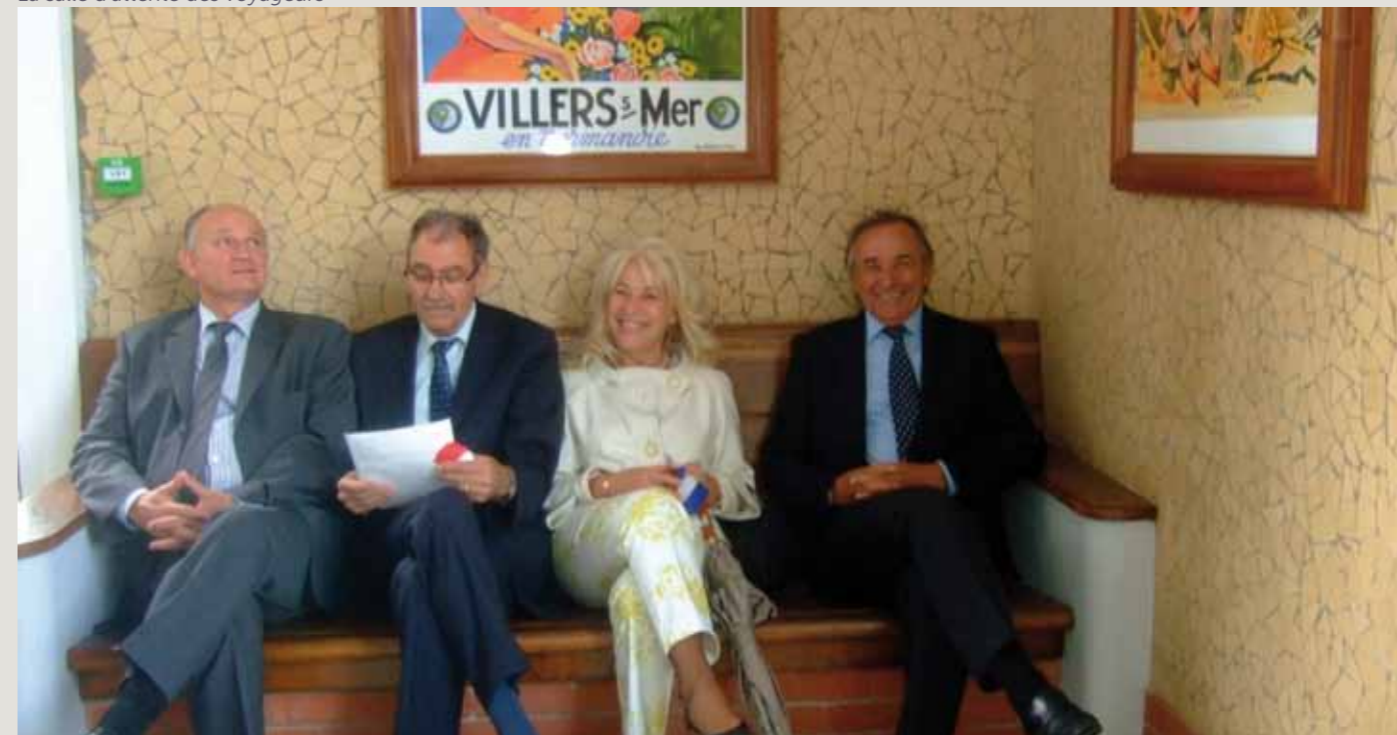
La salle d'attente des voyageurs