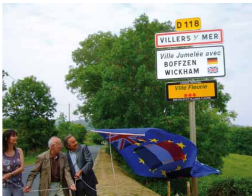
La plaque d'entrée de ville est dévoilée

A l'issue de l'inauguration de la plaque d'entrée de ville, un buffet, dressé sous un barnum, en face de la gare de Villers-sur-Mer, et offert par la municipalité, attendait les participants.