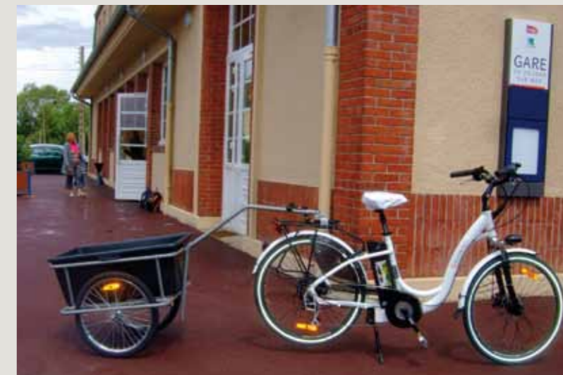
Un vélo électrique, muni d'une remorque, peut être loué pour le transport de voyageurs