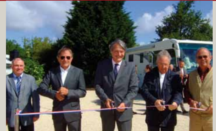
Les officiels coupent le traditionnel ruban

L'investissement est de 178 000 euros HT, financés comme suit : Fonds national d'aménagement et de développement du territoire : 27 960 euros ; Conseil général du Calvados : 7500 euros et le solde par la Communauté de communes : 143 000 euros. La commune de Villers-sur-Mer est propriétaire du terrain. Aménagement paysager, et équipement sanitaires, soit 100 000 euros ont été pris en charge par la mairie de la station. « Cette aire est un exemple de ce qui peut être fait quand des collectivités territoriales s'unissent pour atteindre l'excellence », a souligné le maire.