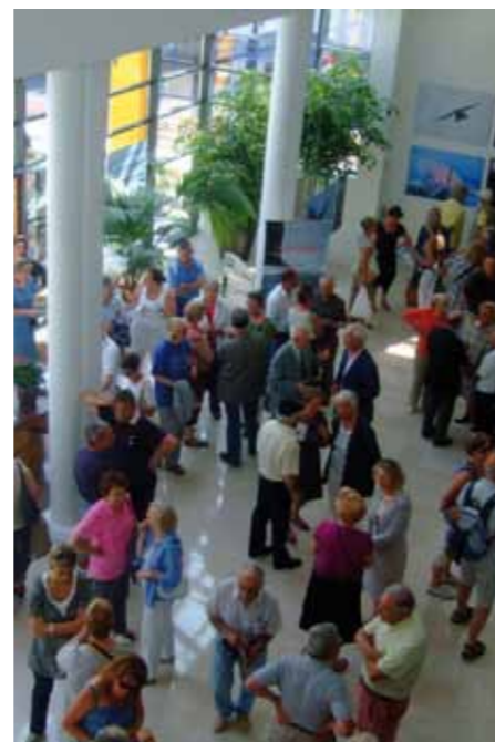
Ce programme est communiqué à titre indicatif ; il peut subir des modifications.

Pratique : Le Villare, 26, rue du Général de Gaulle (en face de l'église) à Villers-sur-Mer. Tél. 02 31 14 51 65.