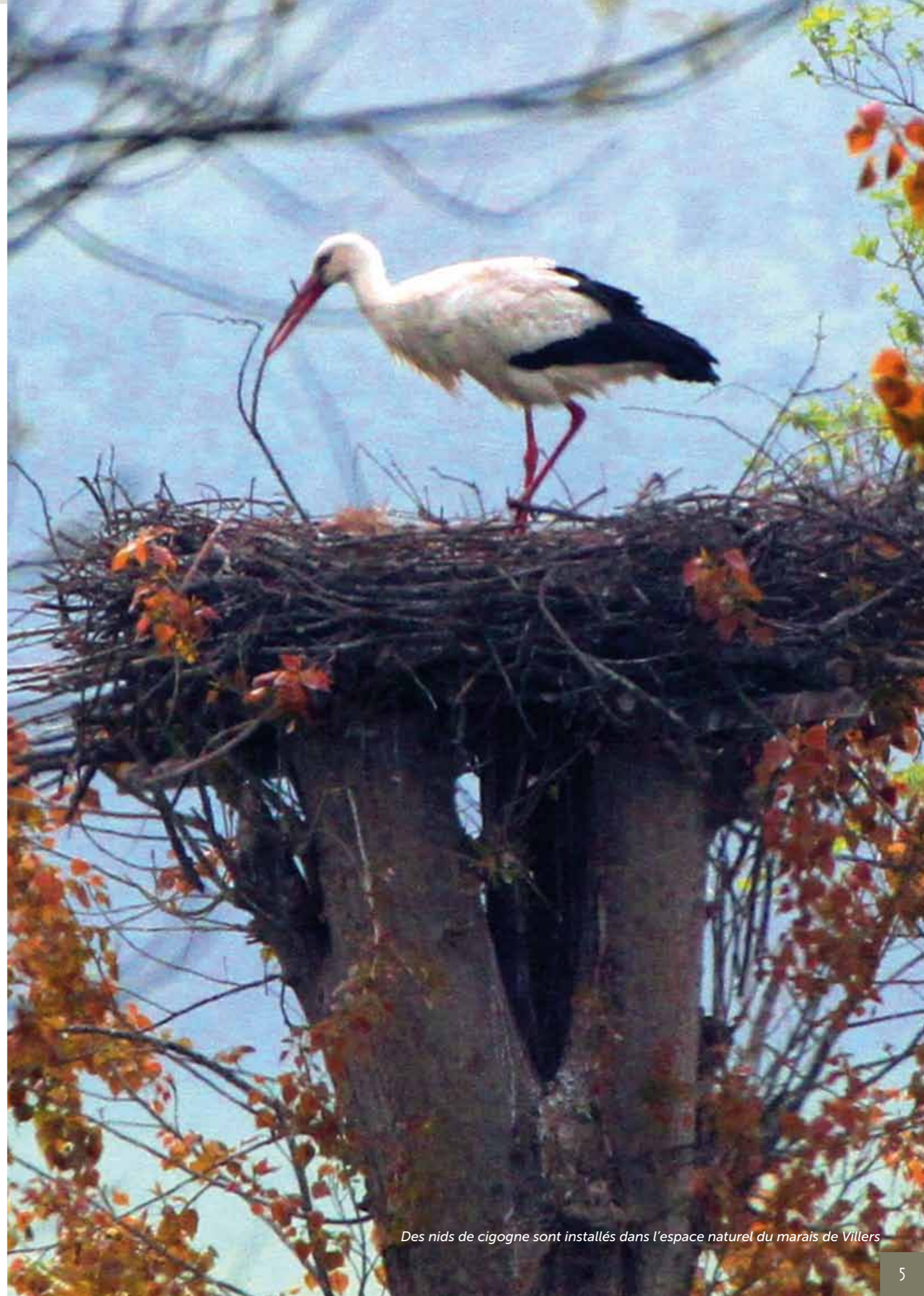
Des nids de cigogne sont installés dans l'espace naturel du marais de Villers

Le Conseil Municipal, après délibération, à l'unanimité : ■ autorise cette modification de la liste des jeux de tables et ce comme sus-indiqué.