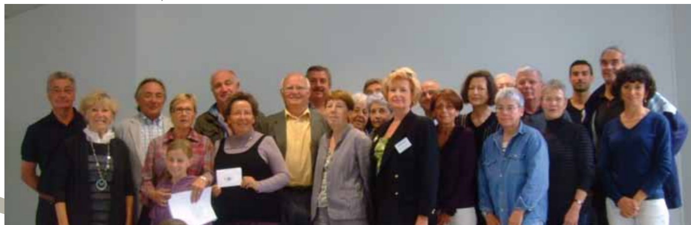
Le maire et l'ensemble des représentants des associations

Organisé par la municipalité, ce forum d'été a rassemblé, l'espace d'un matin de juin, plusieurs associations villersois.