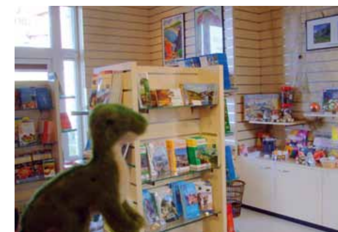
Présentation d'une partie de la documentation