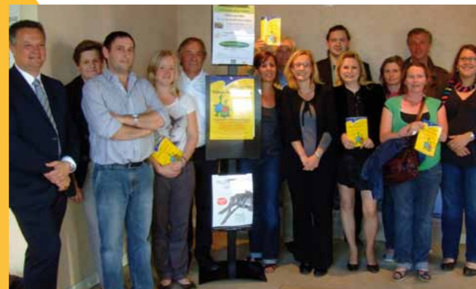
Ci-contre : le lancement du Pass tourisme avec le maire et les commerçants partenaires