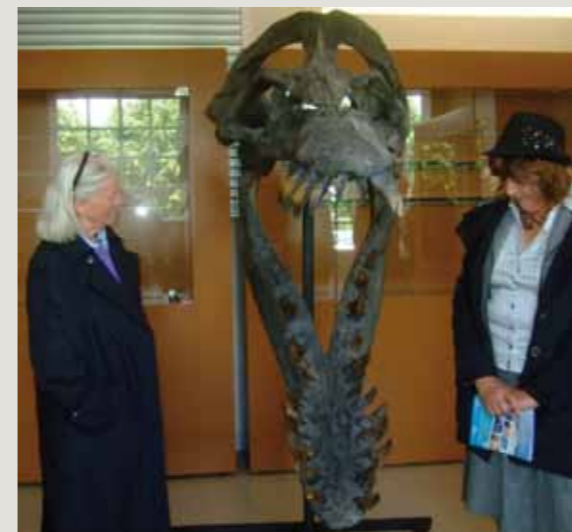
Une salle est dédiée à la paléontologie