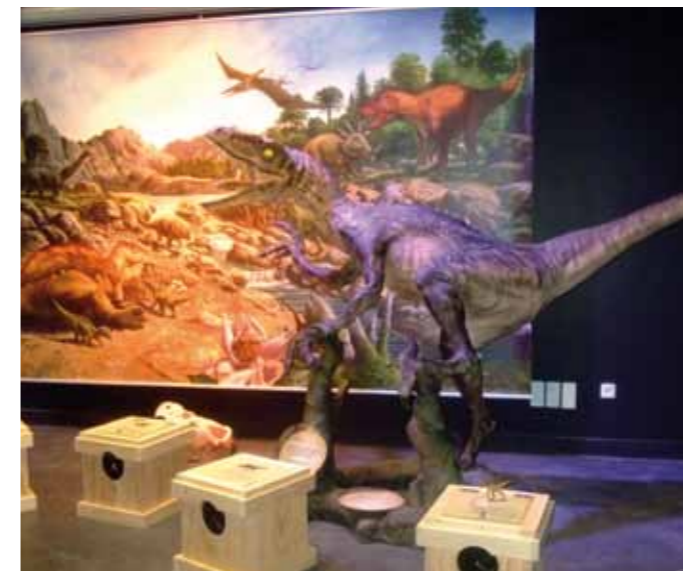
La visite est interactive

Pratique : exposition jusqu'au 31 décembre 2011 au Paléospace, avenue Jean Moulin ; Tél. 02 31 81 77 60. Internet : www.paleospace-villers.fr