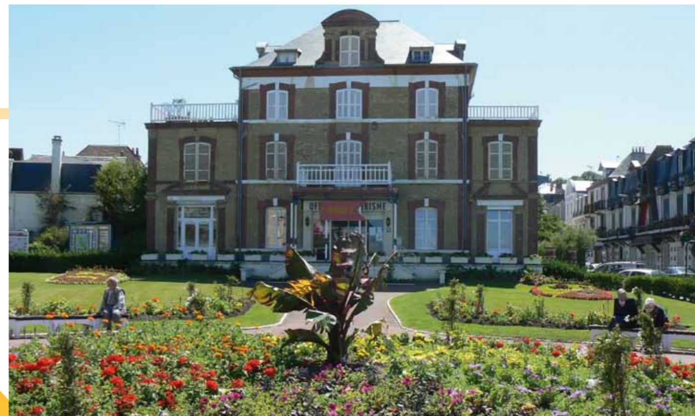
Ci-dessus : l'Office de Tourisme, place Mermoz

Pour contrôler, évaluer, et donc progresser, l'Office de Tourisme met en place des enquêtes de satisfaction auprès de ses visiteurs et procède au traitement des réclamations, tout ceci s'inscrivant dans une démarche « qualité ». Des bilans saisonniers et annuels sont effectués mais aussi des bilans d'opérations (Fête de la Coquille, pot de fin de saison) sont systématiquement élaborés pour mettre en mémoire les aspects réussis d'un événement et à l'améliorer.