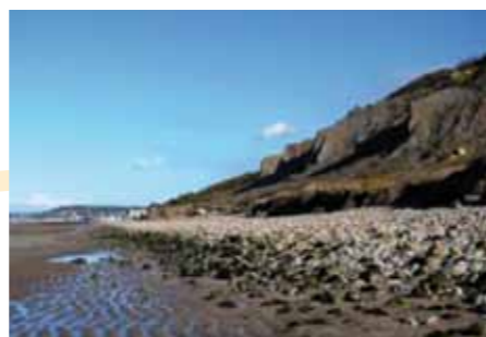
Les Falaises des Vaches Noires sont un haut lieu de la paléontologie

Des soirées mensuelles avec des exposés/conférences donnés, salle Bagot, par des adhérents et invités spéciaux.