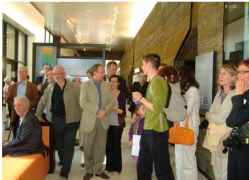
Le public dans la galerie centrale