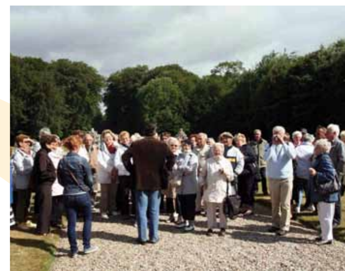
Le voyage à Muchedent

Le groupe était de retour à 19h30 à Villers-sur-Mer, après une journée bien remplie.