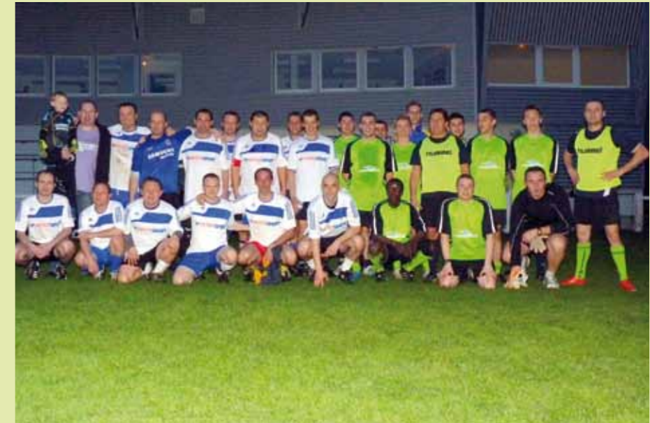
L'équipe de foot des pompiers de Villers (en vert) a rencontré celle du commissariat de Deauville