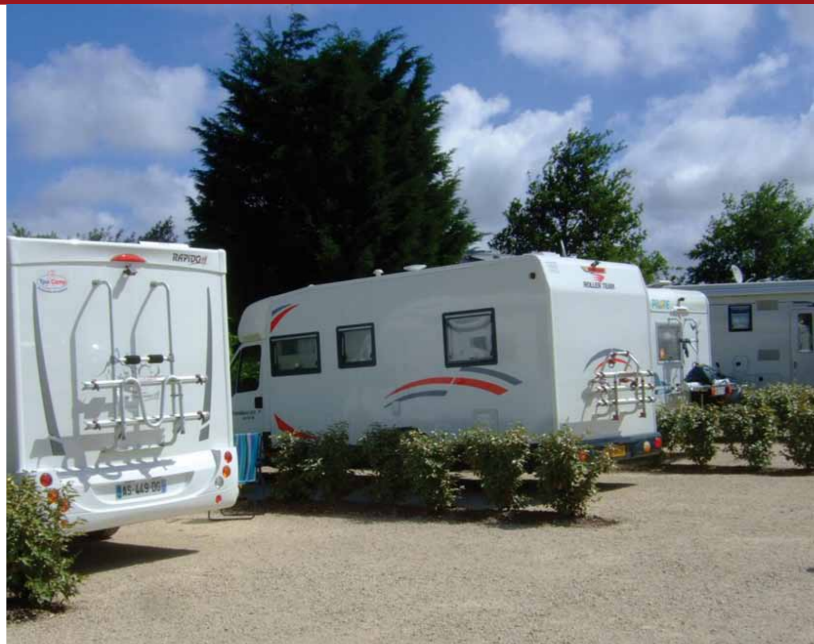
La nouvelle aire de camping-cars