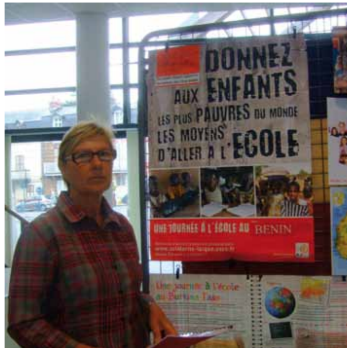
Une nouvelle association était présente : tous pour le Bénin

110 visiteurs se sont rendus au Forum d'été des associations