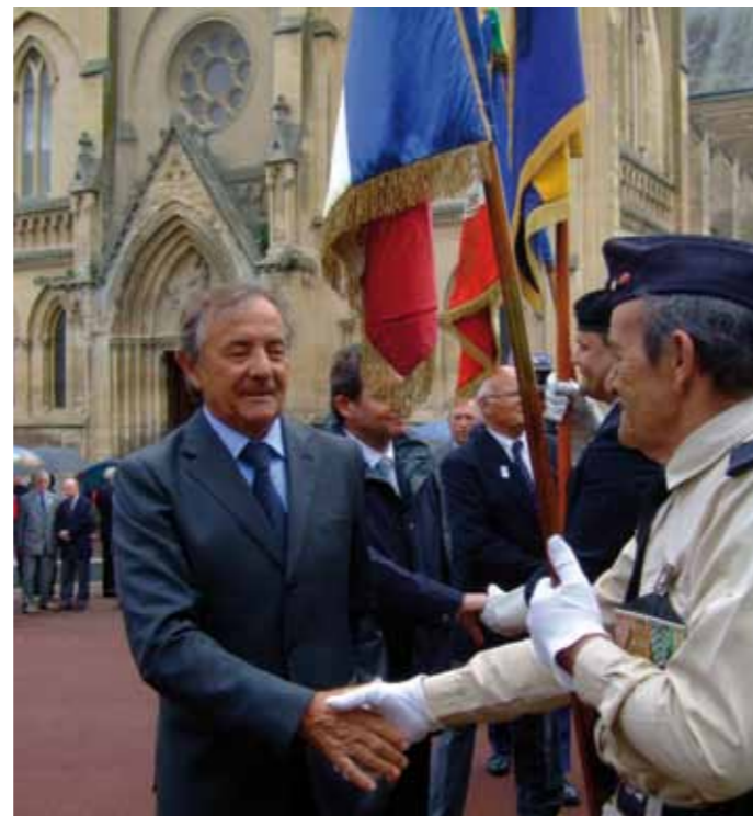
Le maire serre la main des porte-drapeaux