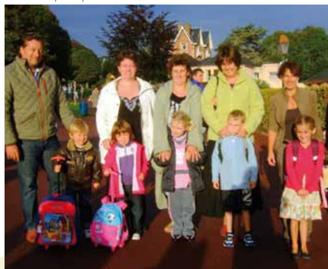
Tous sont prêts pour cette rentrée sous le soleil