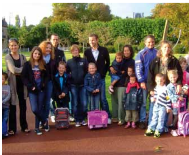
Elèves et parents attendent l'ouverture des portes.