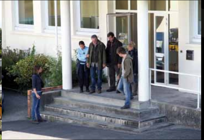
Une scène du film.