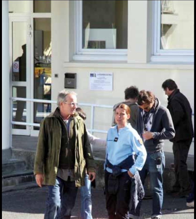
Christophe Lambert et une gendarmette.

La réalisatrice, après avoir promené ses caméras à Deauville, Trouville, Tourgéville est venue tourner dans la station. Anne Fassio a choisi l'univers des courses pour ce long-métrage. Christophe Lambert joue le rôle d'un entraîneur dont la fille devient jockey. Claude Brasseur campe un homme implanté dans le milieu hippique et qui lui prodigue des conseils.