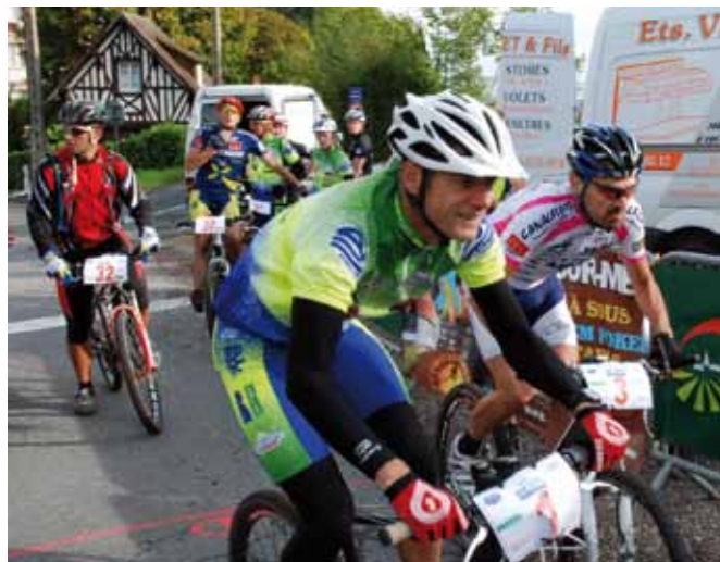
Les concurrents en plein effort

La proclamation des résultats s'est déroulée au gymnase où chaque équipe a été récompensée avant de clôturer la journée par le pot de l'amitié en se disant: à l'année prochaine. La quinzième édition aura lieu le troisième dimanche de septembre, probablement sur un circuit remanié.