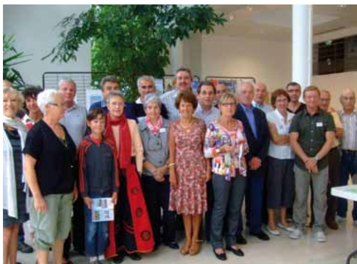
Les représentants des associations