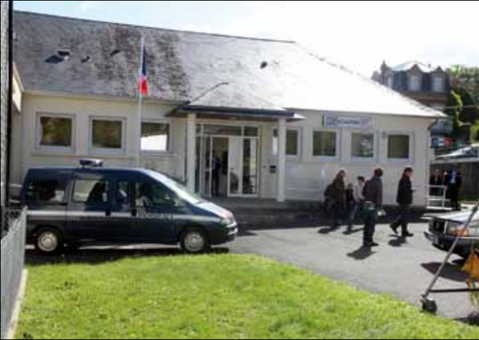
La salle Bagot transformée en gendarmerie le temps d'un film.