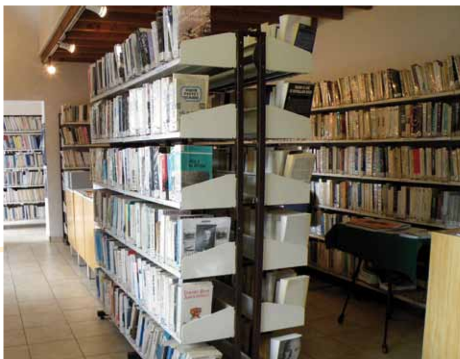
La bibliothèque offre un grand choix de livres à emprunter

Pratique : Bibliothèque pour Tous, 1 rue Comtesse de Béarn. Permanences (sous réserves de modifications) hors saison : mardi et vendredi de 10h30 à 12h et samedi de 11h à 12h.