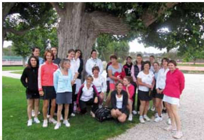
Un tournoi doubles dames a réuni une trentaine de joueuses de plusieurs communes

Contact : Isabelle au 02.31.87.52.40 ou par mail : epicSPORTsetloisirs@hotmail.fr