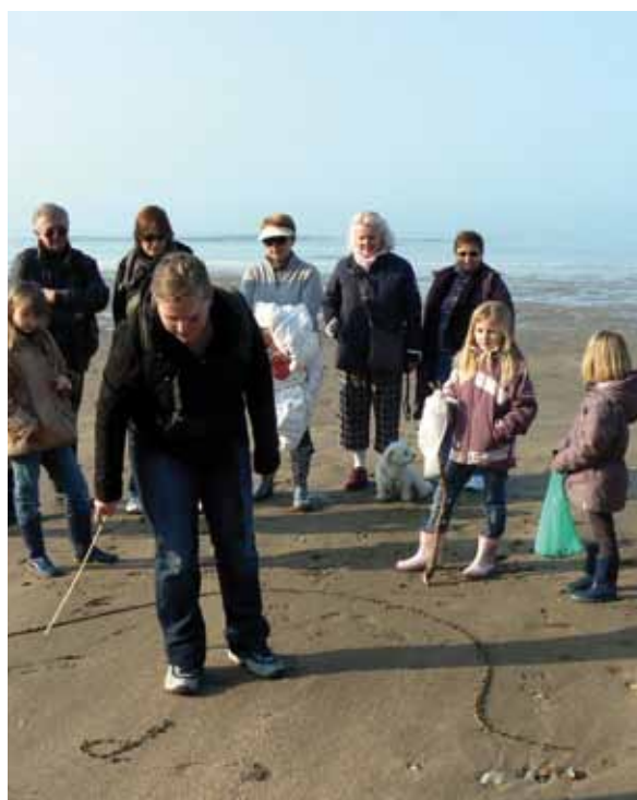
La balade découverte milieu marin a un bon taux de fréquentation