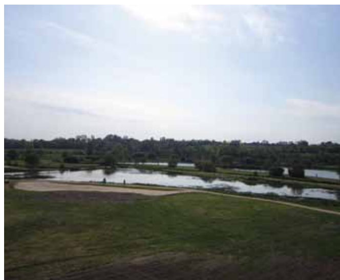
De nouveaux bancs sont prévus au Marais

De nouveaux bancs seront installés et deux terrains de pétanque verront le jour.