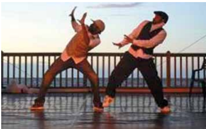
La Compagnie Nejma

Il donne cette année des cours de hip hop aux enfants au Villare.