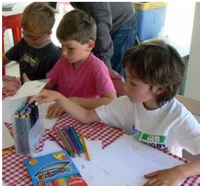
Les enfants sont des fans de la Ligne Imaginaire

La Ligne Imaginaire prépare une exposition au Villare, au printemps 2012, réunissant les oeuvres du collectif d'artistes villersois, «les Z'ailés».