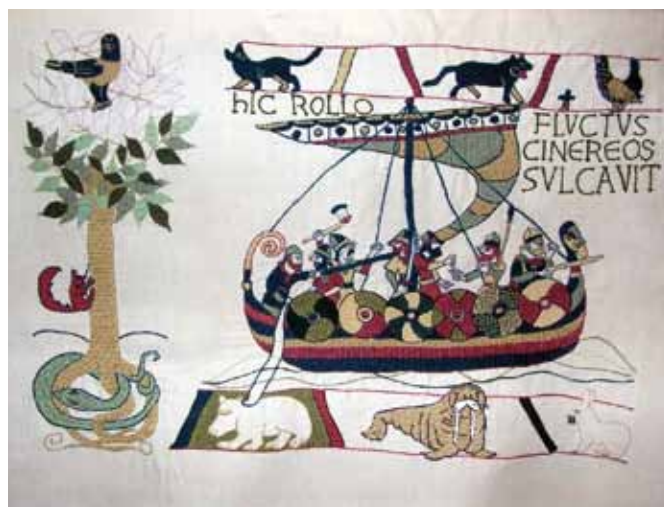
Un détail de la tapisserie