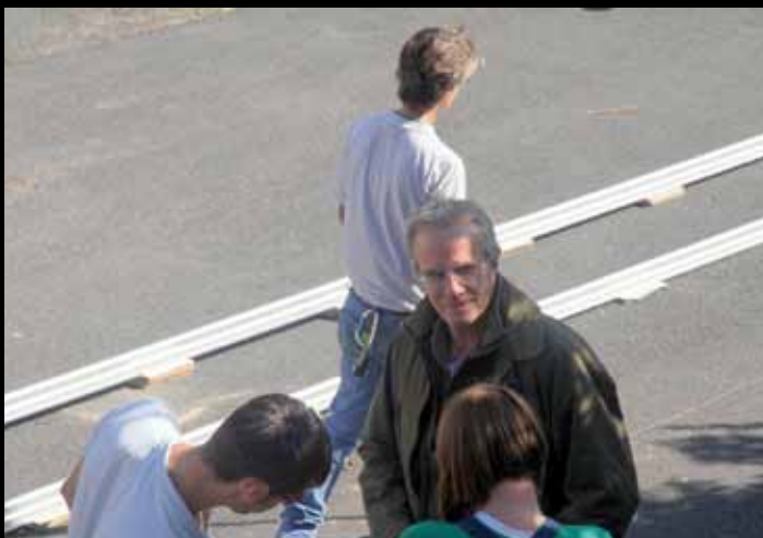
Un petit sourire à l'objectif