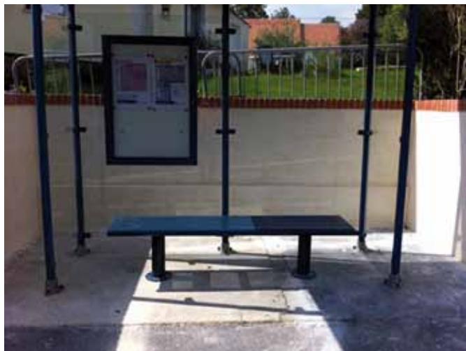
Le nouvel abribus de la Côte de Dives

Un nouvel abri de bus a été posé pendant les grandes vacances.