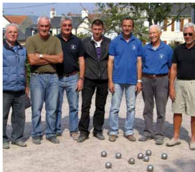
Le pétanque club est en pleine expansion