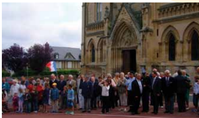
Une foule assistait à la cérémonie.