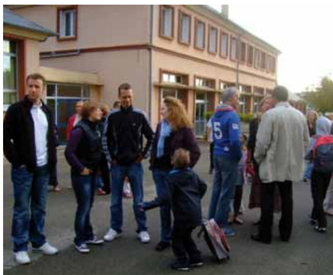
Parents et enfants discutent dans la cour.