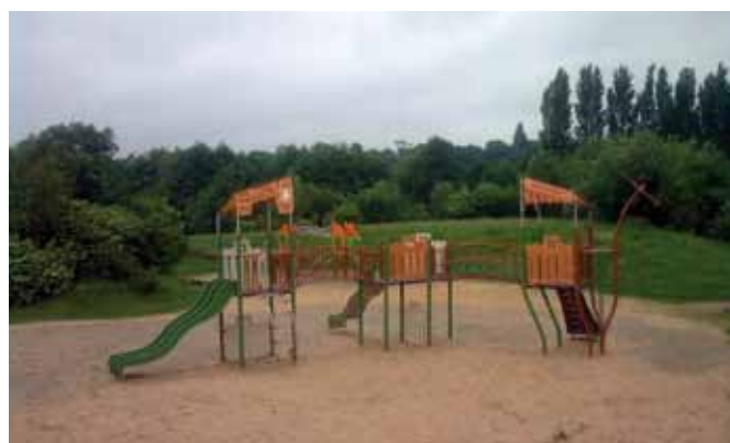
Les aires de jeux seront mises en conformité

L'ensemble des jeux de Villers va faire l'objet, dès le 17 Octobre 2011, d'une mise en conformité. Certains jeux seront remplacés ou ajoutés.