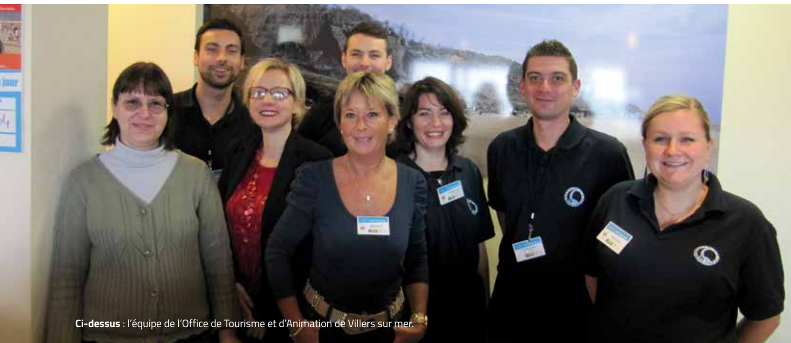
Ci-dessus : l'équipe de l'Office de Tourisme et d'Animation de Villers sur mer.

L'office de tourisme a toujours eu à coeur de valoriser le travail des équipes par l'obtention de labels certifiant la qualité de ses prestations. Citons tout d'abord le Label Famille Plus obtenu en 2009, la marque Qualité Tourisme obtenue en 2011 et le Label Tourisme Handicap obtenu en 2013.