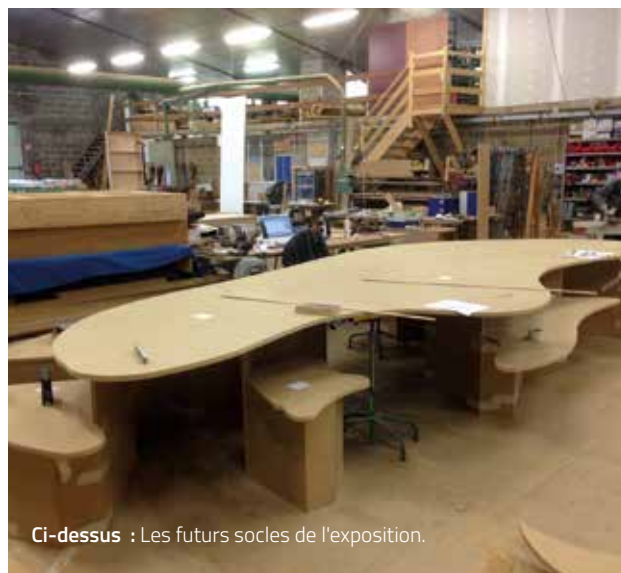
Ci-dessus : Les futurs socles de l'exposition.