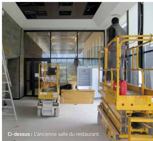
Ci-dessus : L'ancienne salle du restaurant.

L'entreprise qui réalise les 3D des grands squelettes travaille à la modélisation puis place à l'impression 3D, puis la patine et le montage sur place. "Les moulages des pièces des collectionneurs sélectionnées par les paléontologues du comité scientifique sont en cours de fabrication également" précise Karine Boutillier, directrice du Paléospace. Rassemblant un très grand nombre de fossiles de dinosaures de Normandie présentés dans une scénographie originale, ce nouvel espace sera unique en son genre !