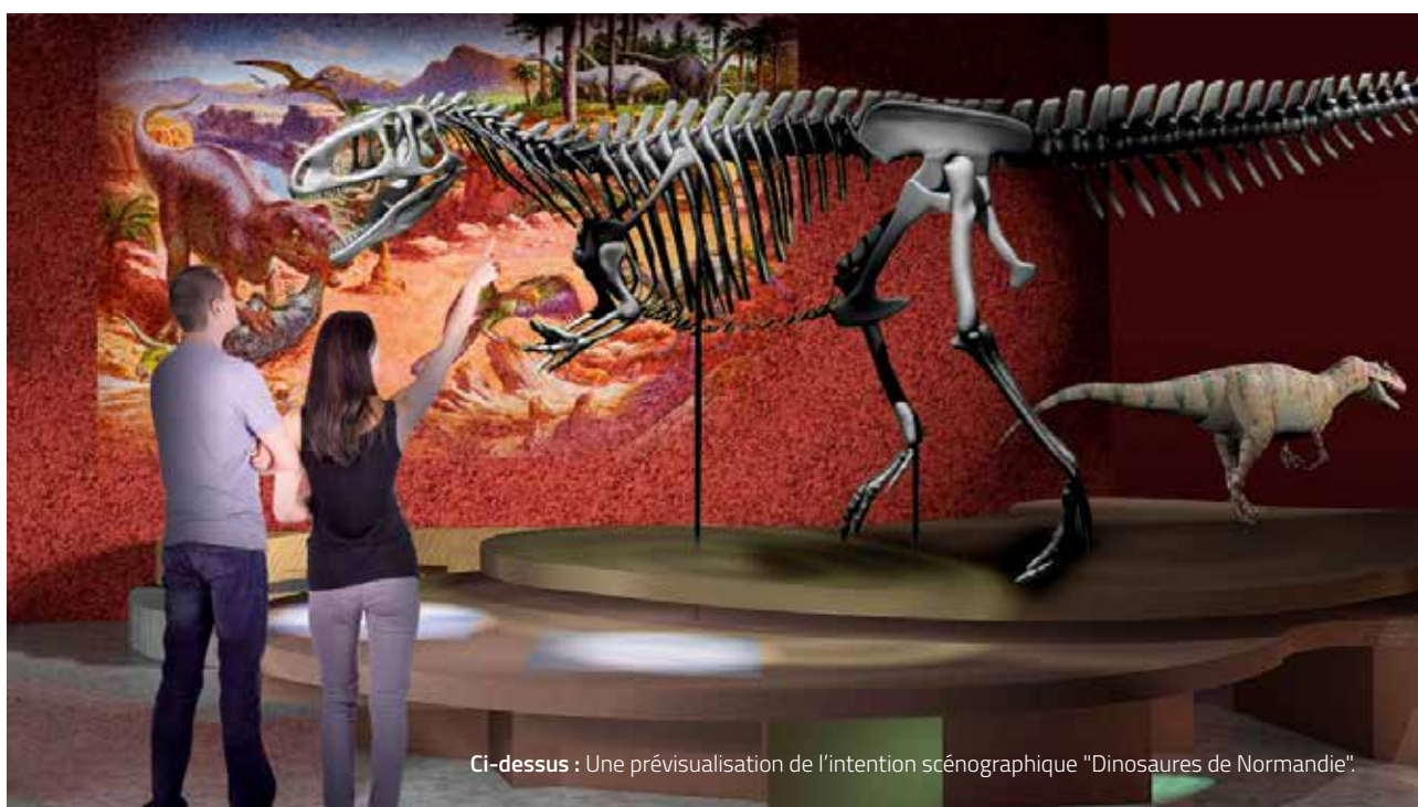
Ci-dessus : Une prévisualisation de l'intention scénographique "Dinosaures de Normandie".