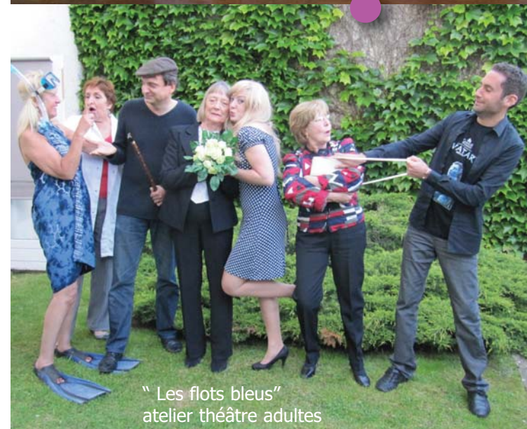
" Les flots bleus" atelier théâtre adultes