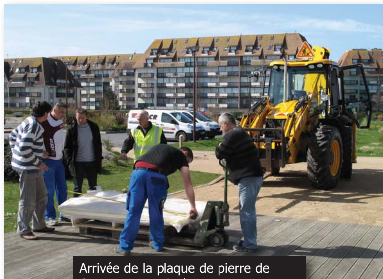
Arrivée de la plaque de pierre de Caen pour servir de support au Dubreuillosaurus valesdunensis