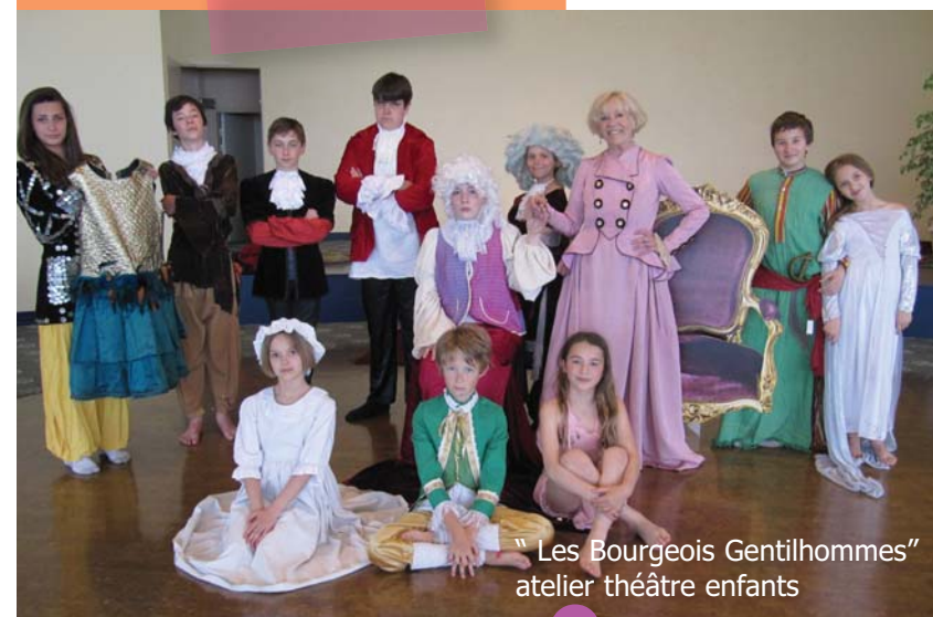
" Les Bourgeois GentilhommeS" atelier théâtre enfants