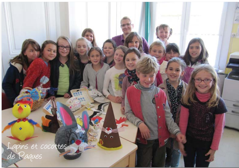
Lapins et cocottes de Pâques

Dès 15h30, les classes se libèrent. Elles sont immédiatement investies pour les activités périscolaire. Telles de petites fourmis, les enseignants, les ATSEM, les membres d'association, au total 25 intervenants se mobilisent pour offrir aux enfants des activités dignes de ce nom ! Il y a au total 40 activités, parmi elles, cuisine, atelier du bois, cerf-volant, théâtre, club anglais, danse country, échecs, jardinage, jeux de plage, karaté... Sous l'œil attentif de Franck Lebaillif et Maud Marschall. « Pour le club photo, six appareils ont été achetés par la municipalité. Le succès est aussi dû à la quantité d'activité ! » Dès la rentrée scolaire, en septembre, 87% des élèves étaient inscrits aux activités périscolaire. Aujourd'hui, on arrive à 98% !