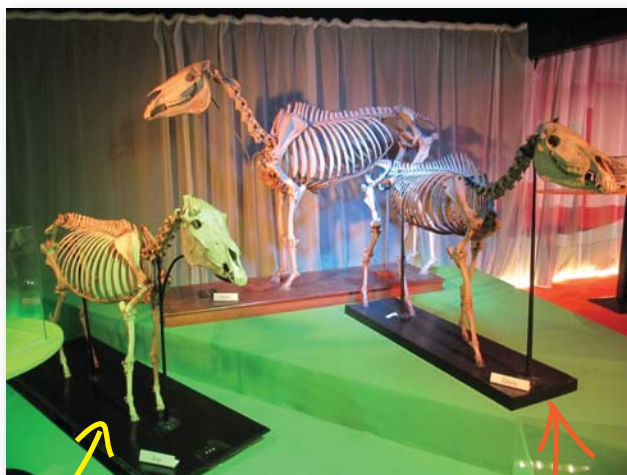
De très belles pièces comme le très rare squelette d'un âne !