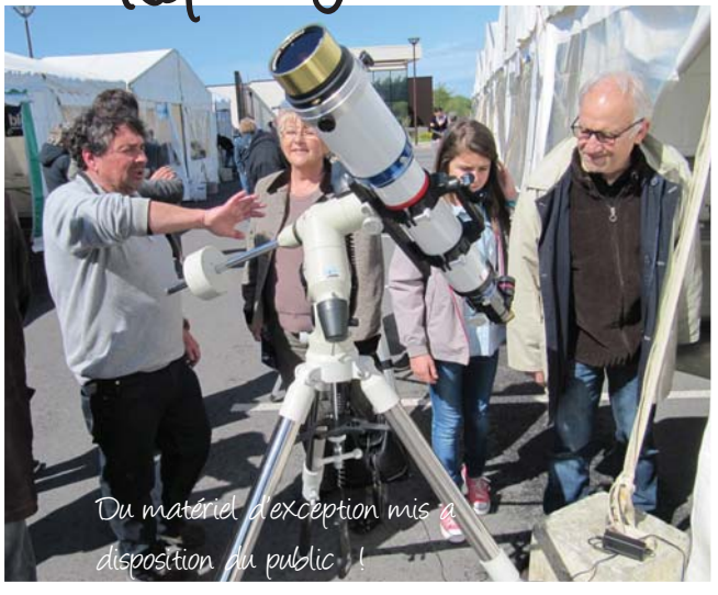
Du matériel d'exception mis à disposition du public !

Conférences, rencontres avec des associations d'astronomie, simulation de vol, ateliers ludiques... Les astronomes d'un jour ont approché des sujets passionnants et accessibles. Les conférences proposées ainsi que les ateliers ont affiché complet !