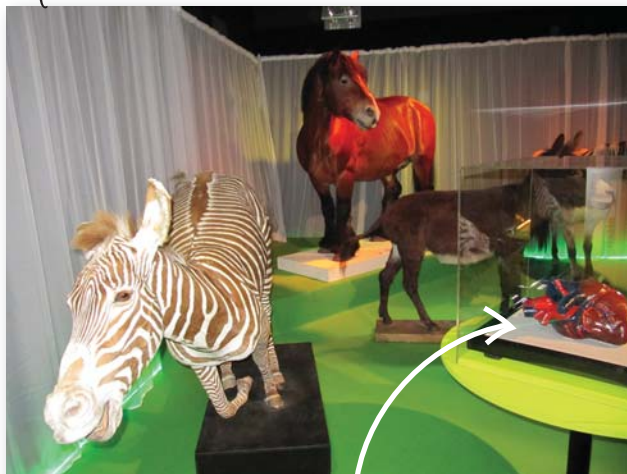
Le cœur de cheval à taille réelle