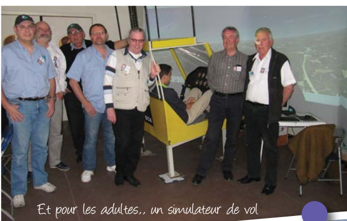
Et pour les adultes,, un simulateur de vol

Grand succès aux ateliers enfants et au simulateur de vol, 800 visiteurs en deux jours !