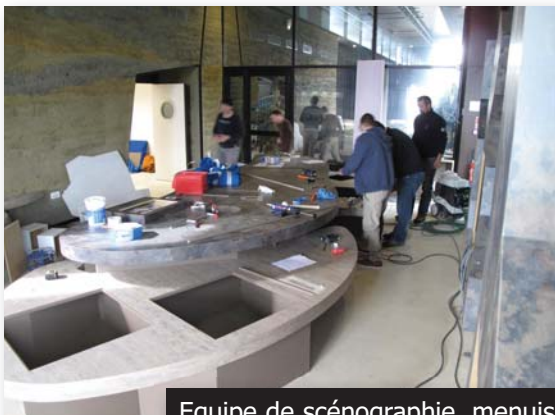
Equipe de scénographie, menuisiers, éclairagistes, créateurs de jeux inter- actifs...