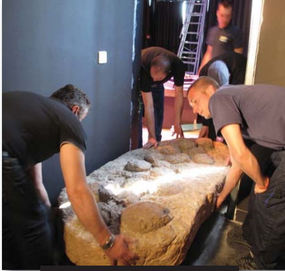
installation du nid de dinosaure