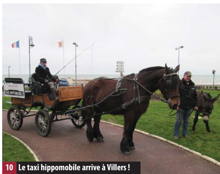
10 Le taxi hippomobile arrive à Villers !