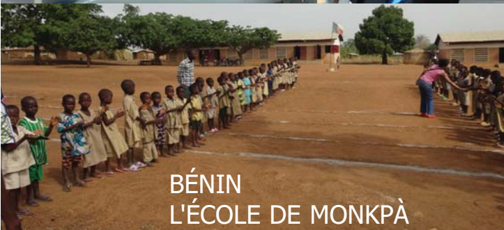
BÉNIN L'ÉCOLE DE MONKPÀ