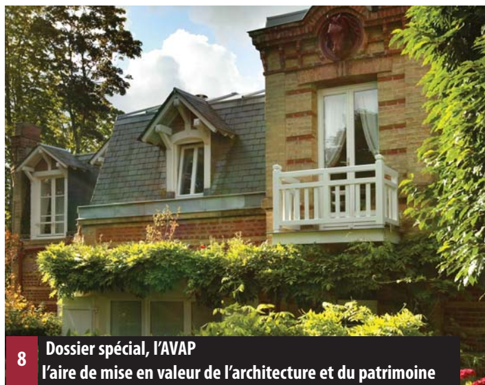
8 Dossier spécial, l'AVAP l'aire de mise en valeur de l'architecture et du patrimoine