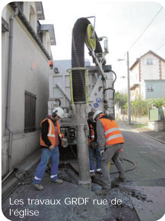
Les travaux GRDF rue de l'église

Un plateau ralentisseur éclairé a été mis en place, ainsi qu'un parking séparé et un trottoir menant à l'avenue de la Brigade Piron, aux normes d'accessibilité.