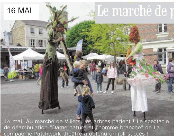
16 mai. Au marché de Villers, les arbres parlent ! Le spectacle de déambulation "Dame nature et l'homme branché" de La compagnie Patchwork théâtre a obtenu un joli succès !