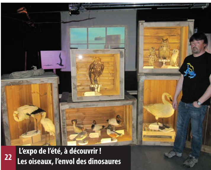
22 L'expo de l'été, à découvrir ! Les oiseaux, l'envol des dinosaures