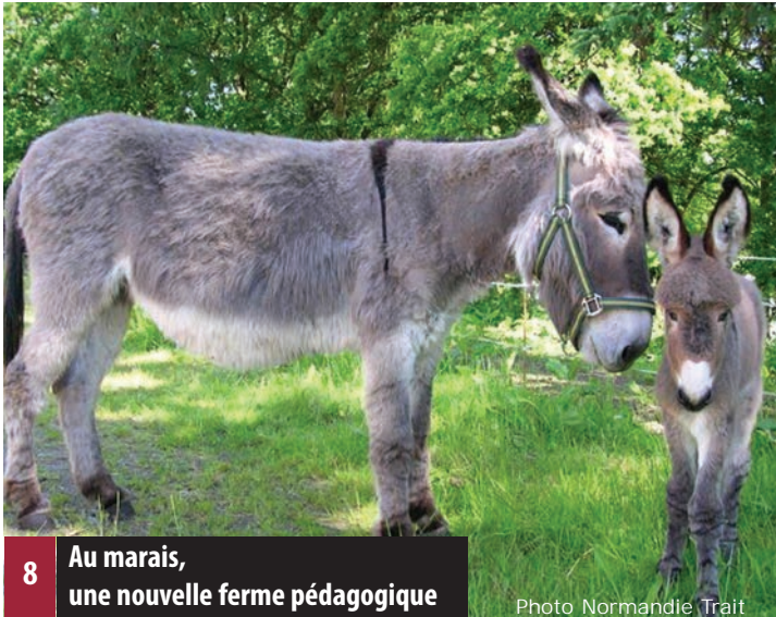
8 Au marais, une nouvelle ferme pédagogique