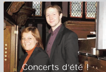
Concerts d'été !

Mardi 11 août, à 20h30, "Brillon à Villers", salle panoramique du casino. Une soirée très XVIIIe siècle ! Tarif : 7€.