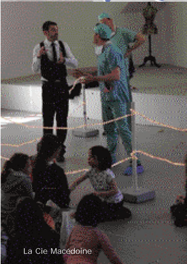
La Cie Macédoine