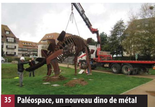
35 Paléospace, un nouveau dino de métal