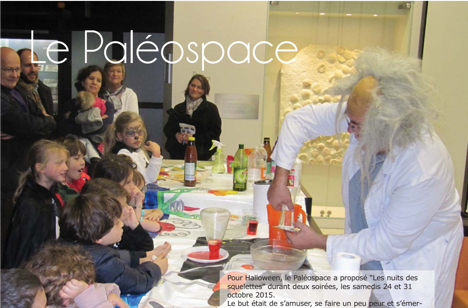
Pour Halloween, le Paléospace a proposé "Les nuits des squelettes" durant deux soirées, les samedis 24 et 31 octobre 2015. Le but était de s'amuser, se faire un peu peur et s'émerveiller à la découverte de la "magie" des sciences.