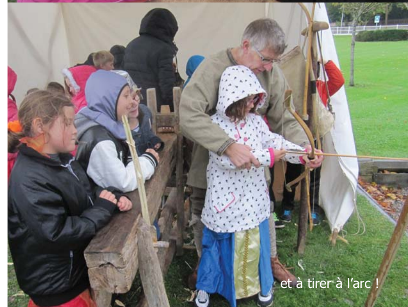
et à tirer à l'arc !