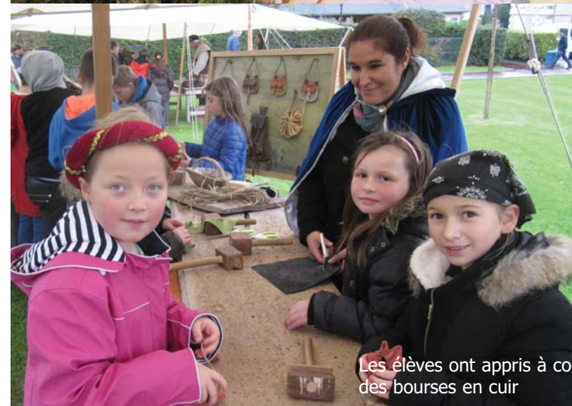
Les élèves ont appris à confectionner des bourses en cuir