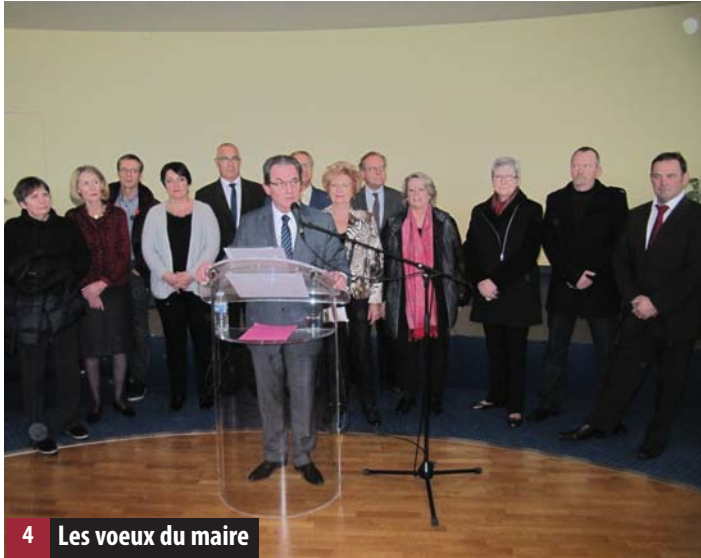
4 Les vœux du maire