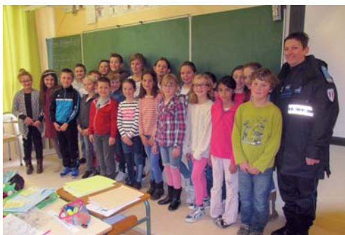
25 APS, la police municipale intervient à l'école