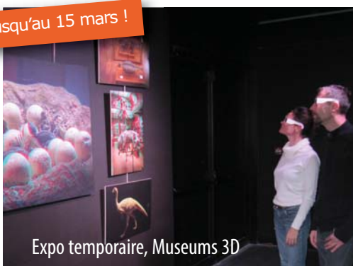
Expo temporaire, Museums 3D