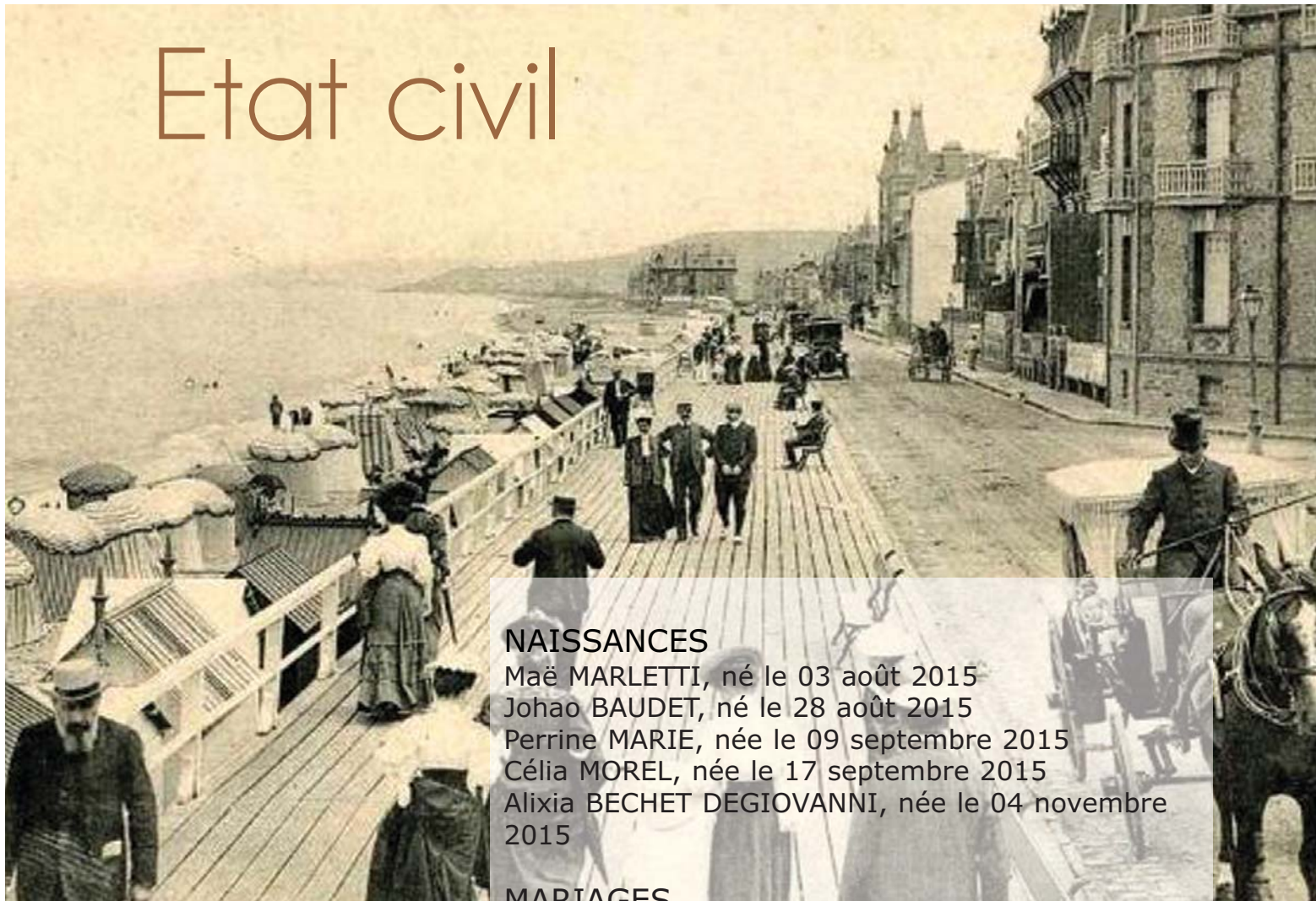
Villers, les planches