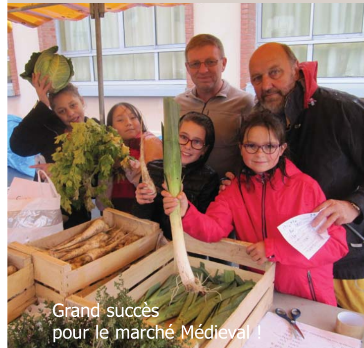
Grand succès pour le marché Médiéval !