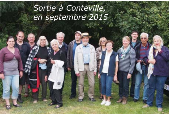
Sortie à Conteville, en septembre 2015

Samedi 12 mars A 18h30, salle Bagot Assemblée générale du Comité de jumelage