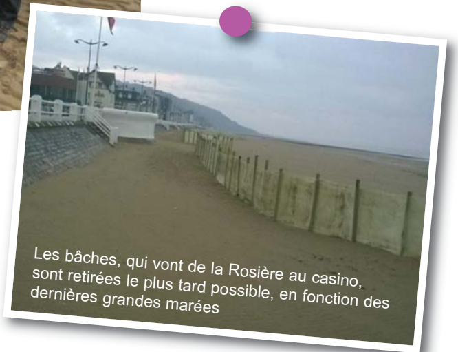
Les bâches, qui vont de la Rosière au casino, sont retirées le plus tard possible, en fonction des dernières grandes marées