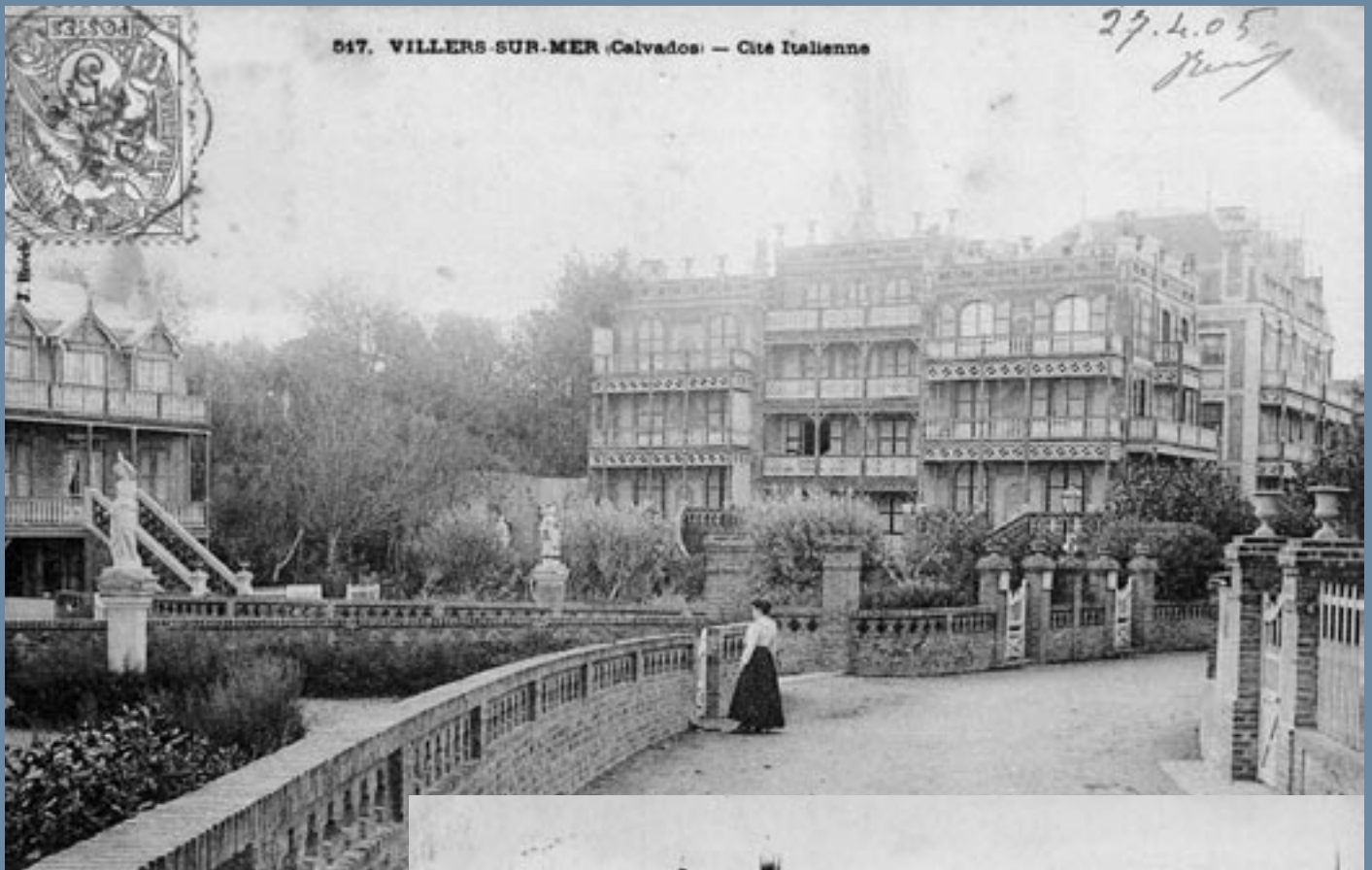
017. VILLERS-SUR-MER (Calvados) - Cité Italienne