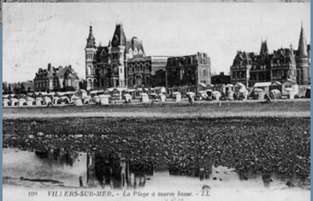
109 VILLERS-SUR-MER. - La Plage à marée basse. - LL