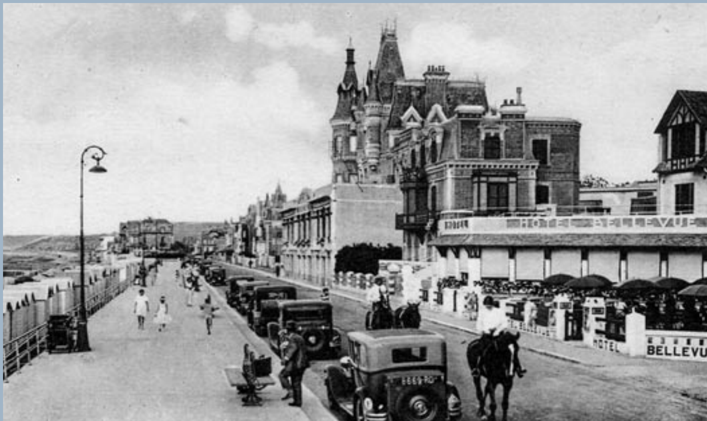
Dans les années 60