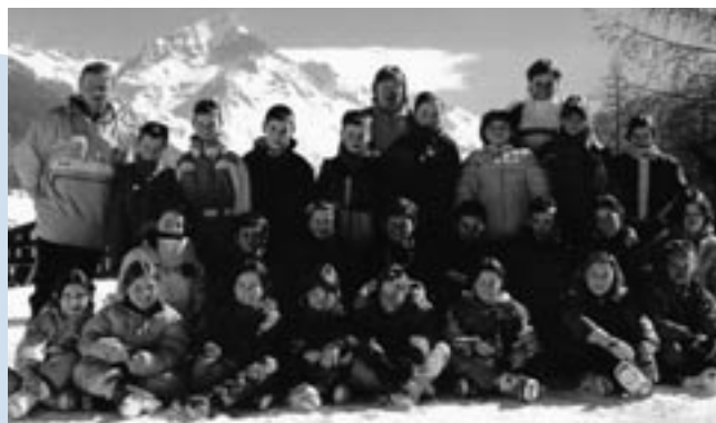
Les 2 classes de neige

Nous vous invitons à participer à notre prochain Loto qui aura lieu le 26 Novembre à la salle du casino.