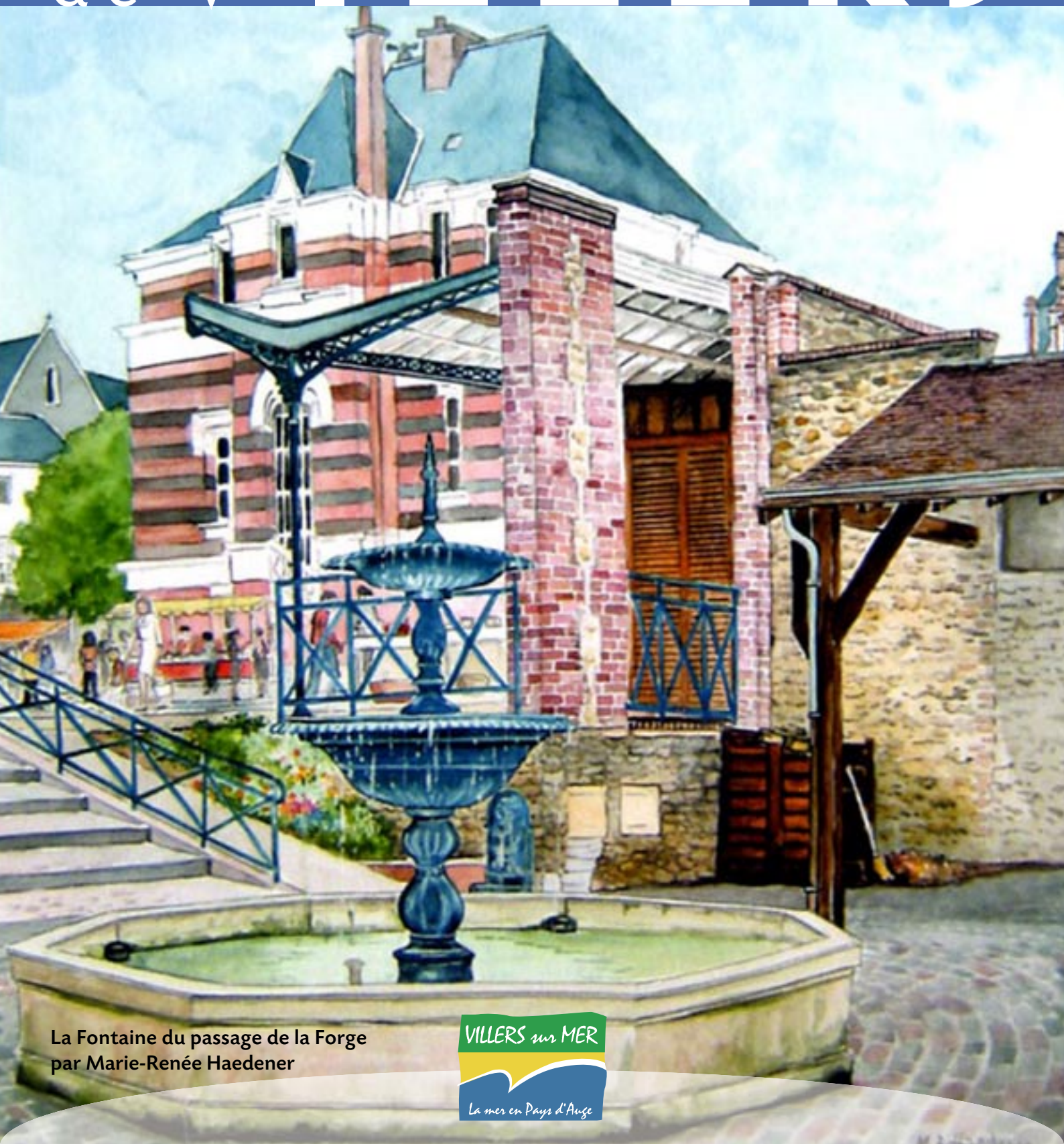
La Fontaine du passage de la Forge par Marie-Renée Haedener