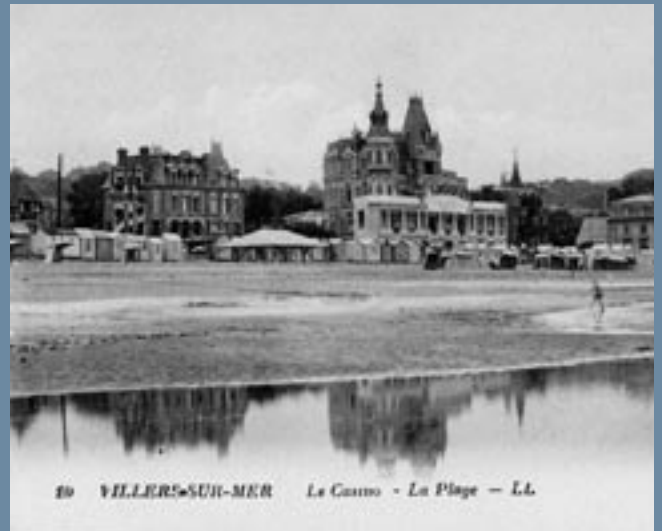
10 VILLERS-SUR-MER La Casse - La Plage - LL

La Cité Italienne en bord de mer au début du 20e siècle.