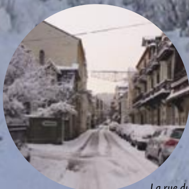
La rue du Maréchal Foch