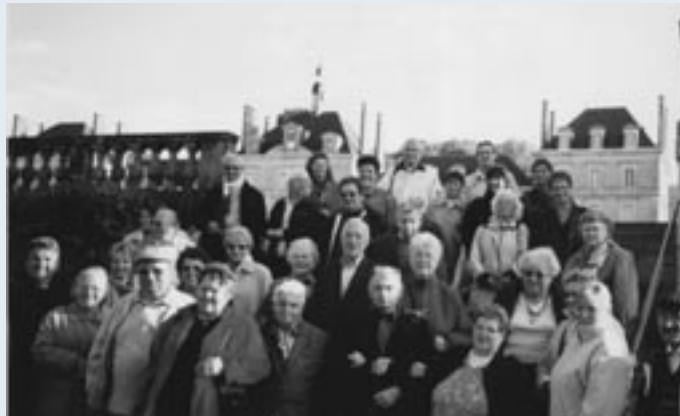
En promenade à la Chapelle Montligeon