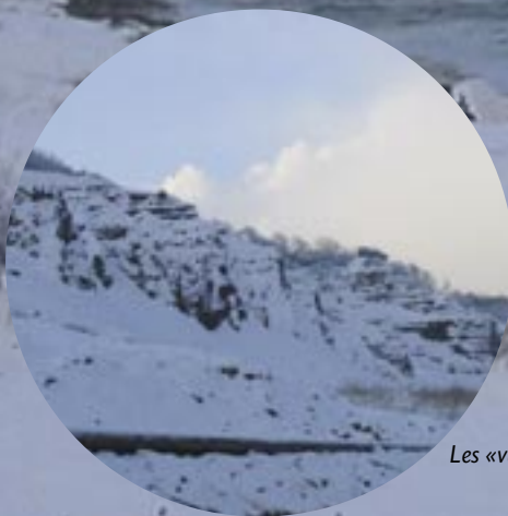
Les «vaches blanches»