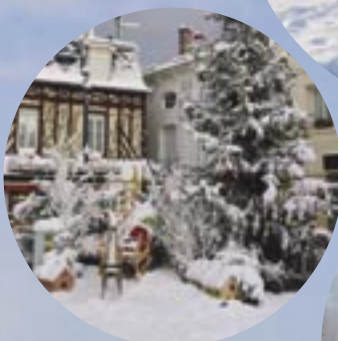
La place Jeanne d'Arc et son Père Noël ont revêtu un décor féerique.