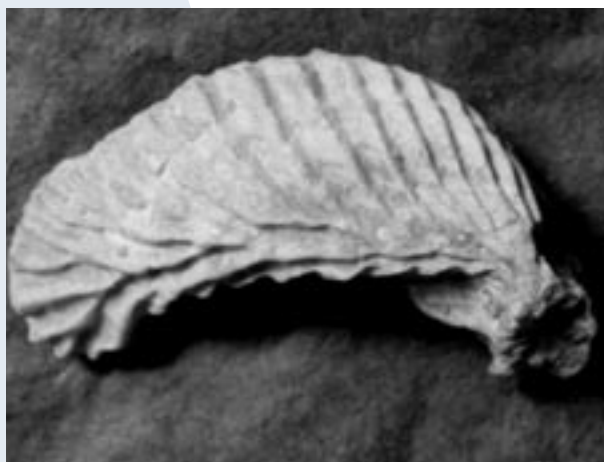
Lopha gregarea Sowerby 1816

Cette circulation de l'information, cette mise en commun de la connaissance, ce sont les tâches auxquelles s'attache l'Association paléontologique de Villers-sur-Mer depuis plus de 25 ans. Participer à ses activités vous permettra une meilleure appréciation de vos trouvailles, voire même une reconnaissance scientifique de celles-ci lorsqu'elles contribuent à faire reculer, si peu que ce soit, la part encore ignorée de l'histoire de la terre et de celle de la Vie.