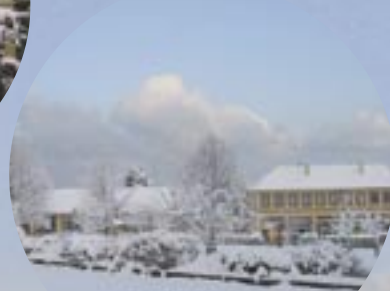
Le jardin public et le groupe scolaire tout de blanc vêtu.