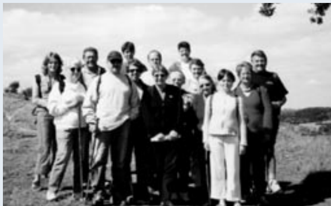
En promenade dans notre Pays d'Auge