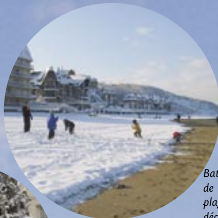
Bataille de boules de neige sur la plage avec comme décor les Vaches Noires