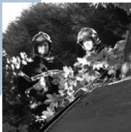
Les pompiers à l'entraînement.